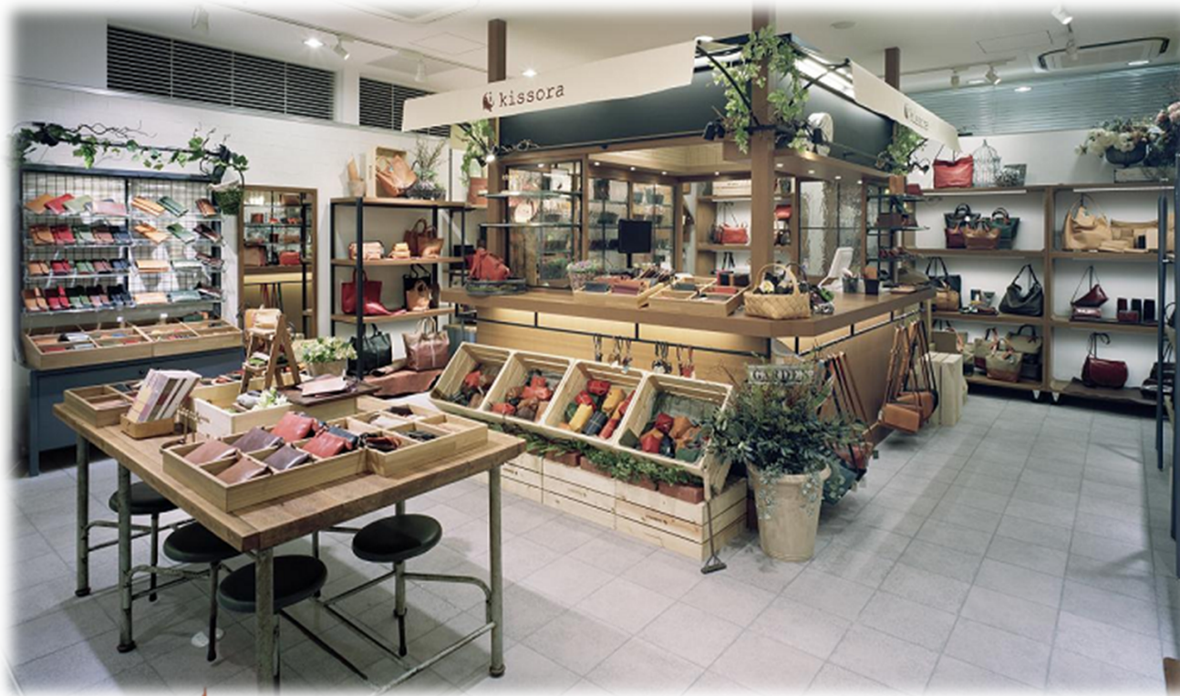
(a)キソラ東京ソラマチ店(東京ソラマチ東街区1F 2012/5 OPEN)