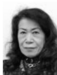
所有する当社株式の数 1,300株