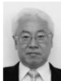
所有する当社株式の数 2,400株