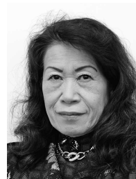
所有する当社株式の数 5,700株